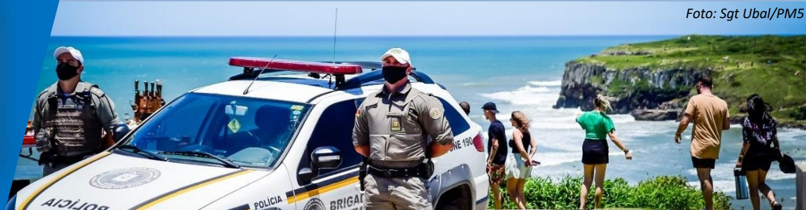
“Visibilidade, repressão qualificada e bem-estar policial militar” - Ano 2 – Nº 08 – Abril 2021