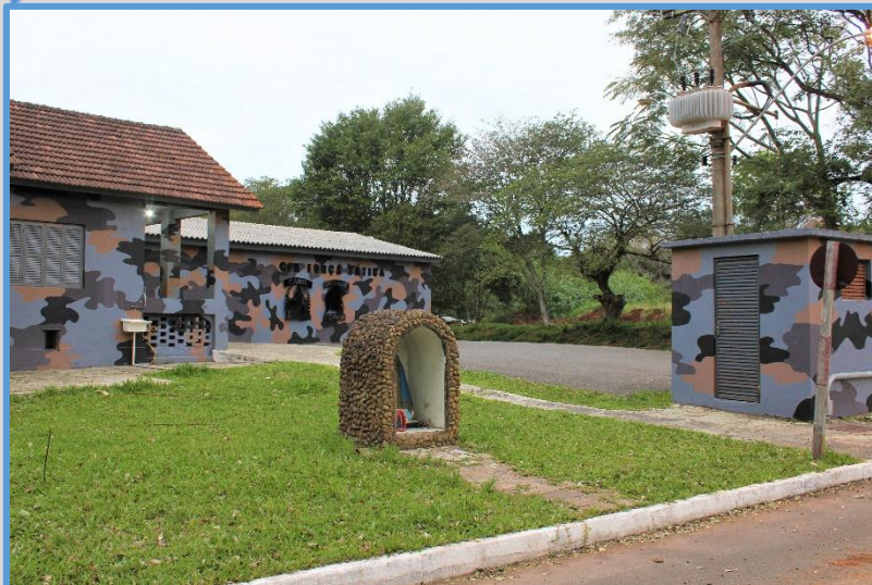
Imagem da sede da Força Tática - 2021

Com treinamentos específicos para determinadas ocorrências, como atuação em controle de distúrbios civis e tumultos, ações para restabelecimento da ordem pública, tais como manifestações públicas, interdições de vias, rebeliões em estabelecimentos prisionais e outras situações que necessitem de uma tropa composta para atuação.